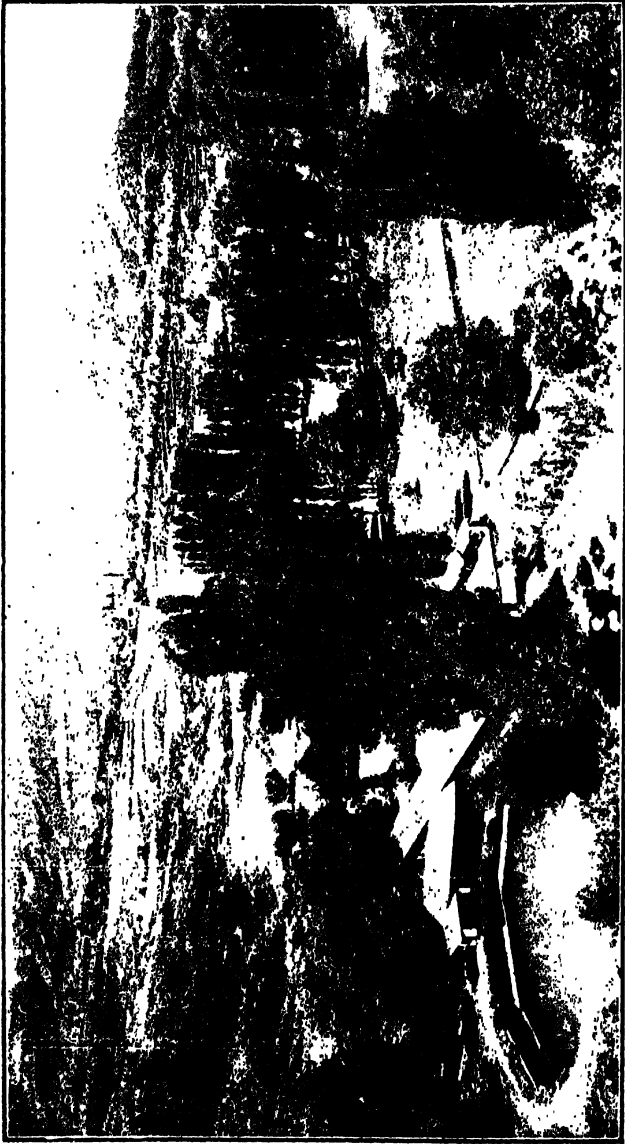
Frontispiece Nila-Kundam (or the present Vairi Nág)